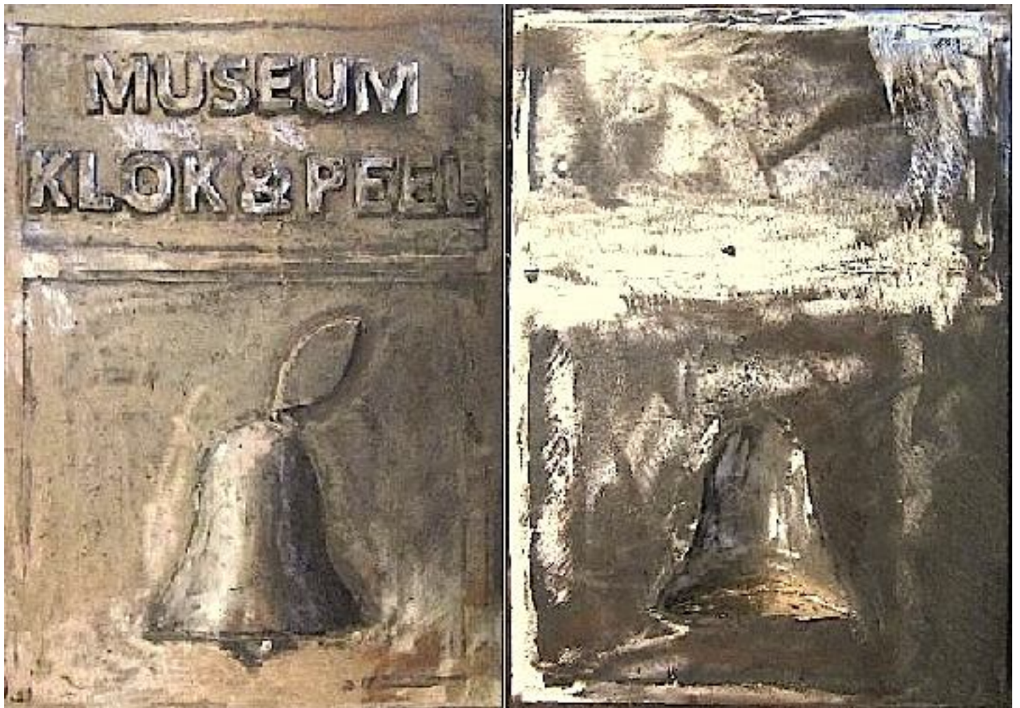
De plaquette moet nog veel worden geschuurd.